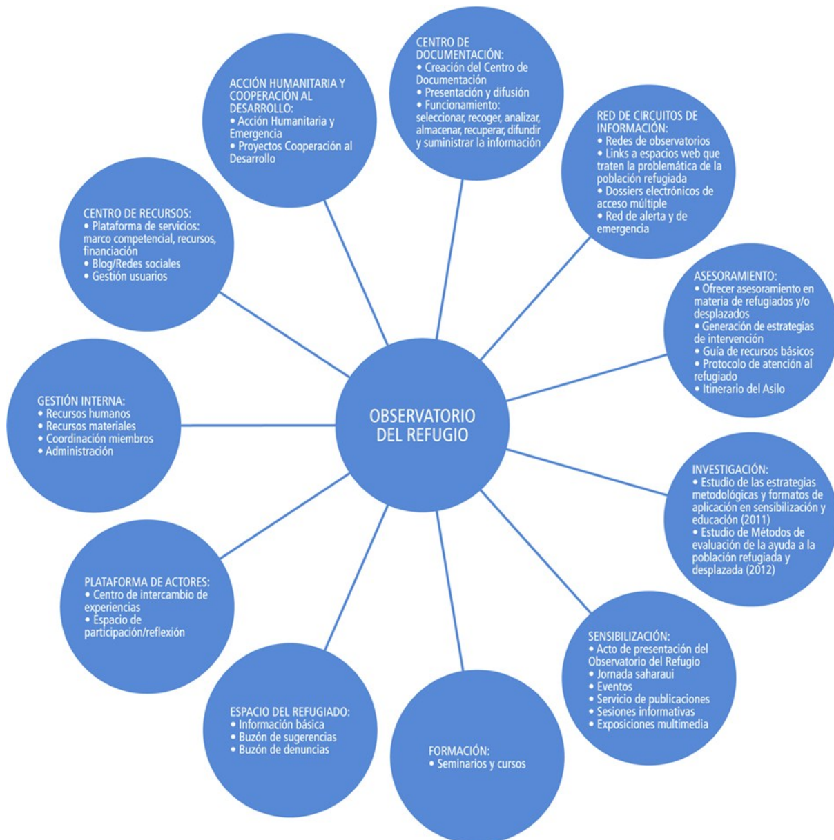
DIAGRAMA DE FUNCIONES